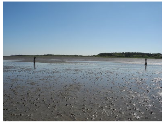
Ebbe im Wattenmeer bei Cuxhaven

Sie sind besondere Bauwerke und zeigen auch alte Kunst von früher.