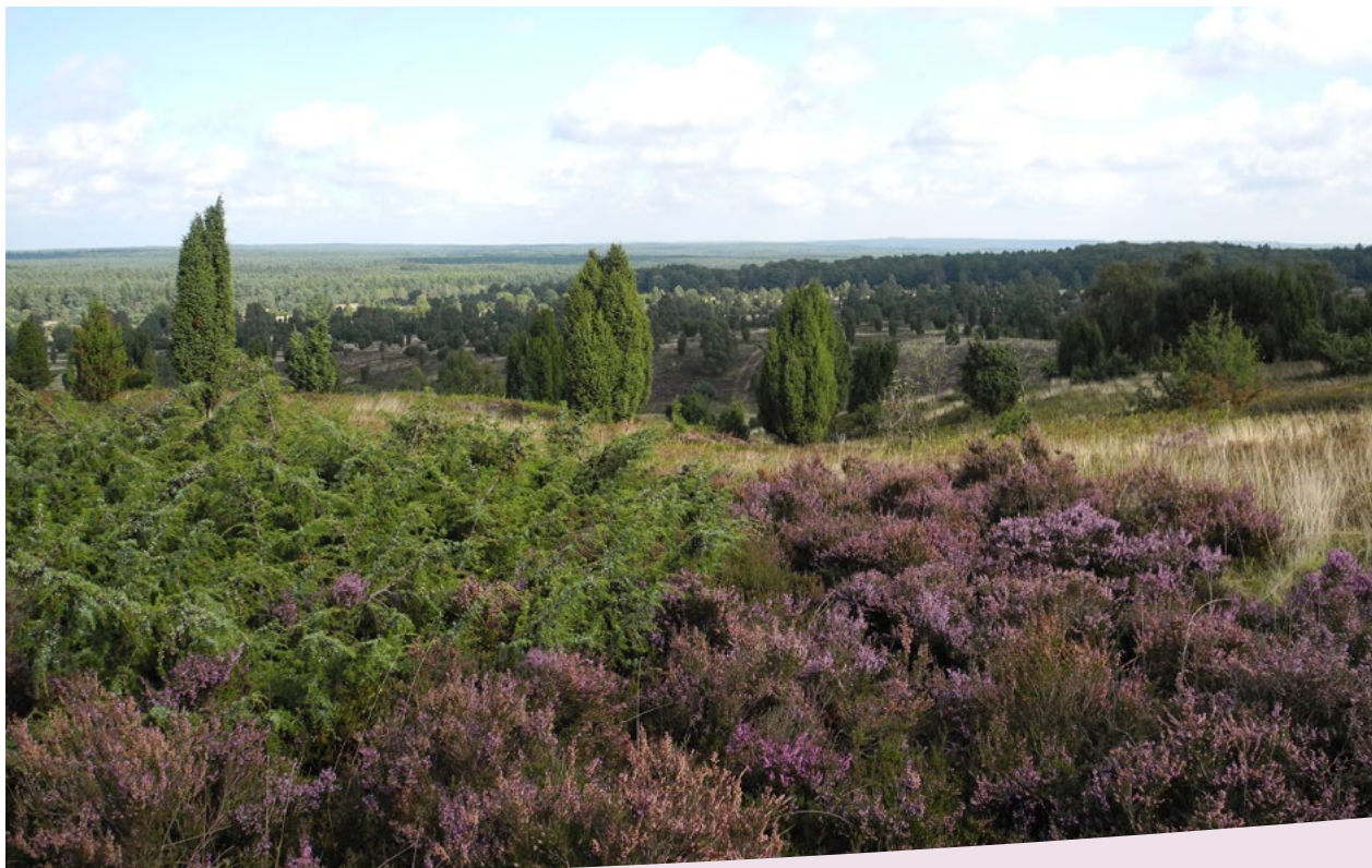
Die Lüneburger Heide

An vielen Stellen ist der Boden auch sandig.