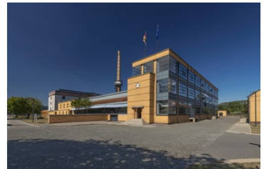
Das Fagus-Werk in Alfeld

Dort gibt es Infos über das Gebäude und die Schuh-Formen.