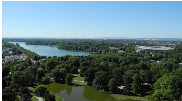
Blick vom Rathaus: Vorne ist der Maschteich, dahinter der Maschsee. Rechts sieht man das Stadion.