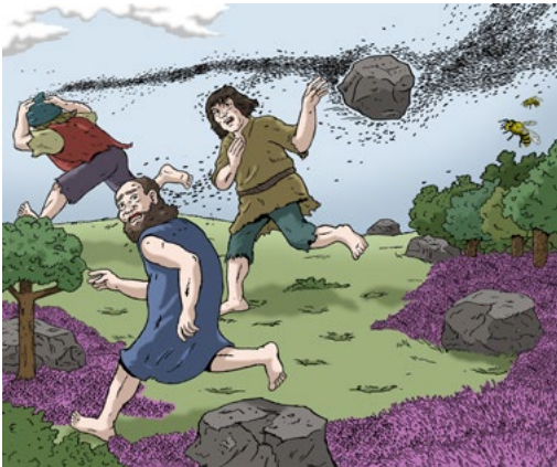
Die Riesensteine aus der Lüneburger Heide