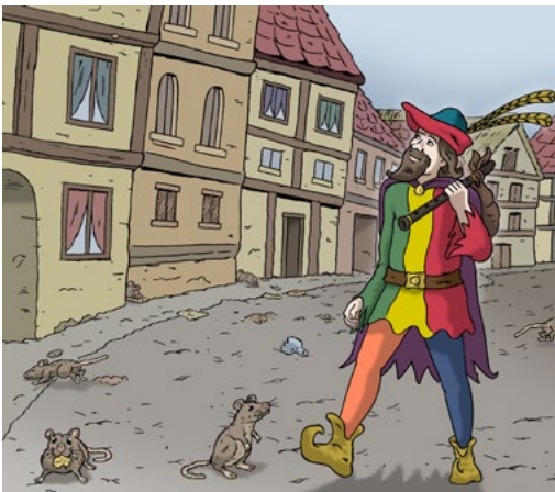
Der Rattenfänger von Hameln

Wollen Sie die Geschichte anhören? Öffnen Sie die Foto-App auf Ihrem Handy und halten Sie das Handy vor den QR-Code. Dann kommen Sie zur Internet-Seite mit allen Geschichten.